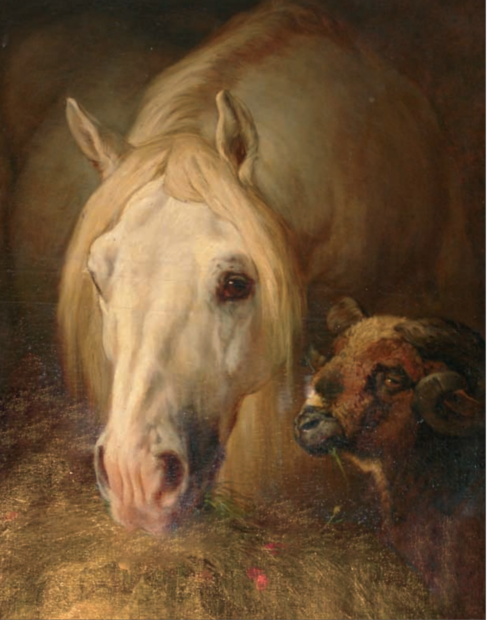
Schloss Slatinany, Aquarell, «Schimmel mit Schaf».