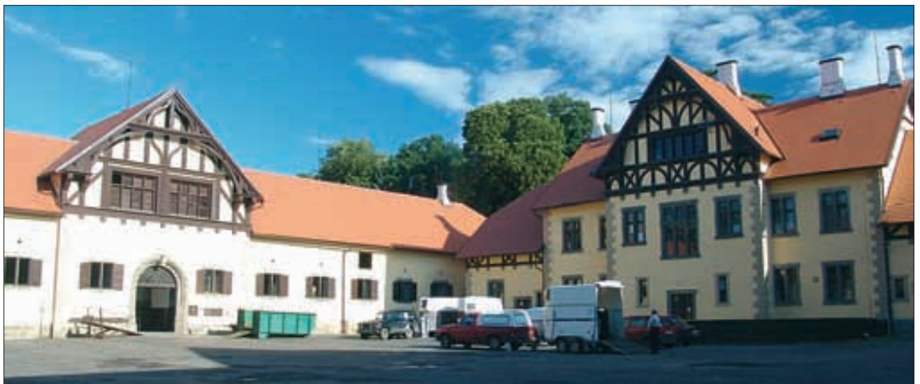
Gestütshof von Slatinany, Innenhof.

Neun Fohlen und neun Enkel 1. Hasana, 1988, CZ-Pisek von 283 Sultan AV, Topolcianky aus der Kuhailan Urkub-20, Topolcianky Note 8.19