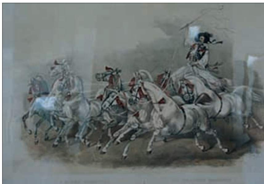
Schloss Slatiny, Aquarell, «Ungarische Post».

Rappen. Die Realisierung des Museums im Schloss, bedeutete dessen Rettung vor einer Liquidierung. Professor Bilek war ein grosser Freund des Pferdes in der Kultur. In seiner Begründung zum Antrag zur Gründung des Museums verwies er auf die riesigen Dienste, die das Pferd dem Menschen erwies, auf die gewaltigen Opfer, die die Pferde für den Menschen gebracht haben und auch auf die ästhetischen Werte, die das Leben des Menschen durch die Kunst berei-