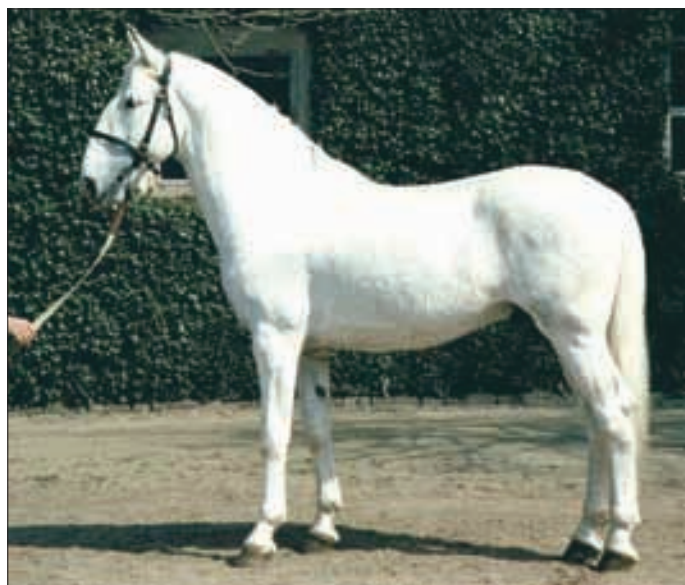
Hengst Generalissimus XLII, geboren 1999 (Foto D.Bouma/Prag 2004).