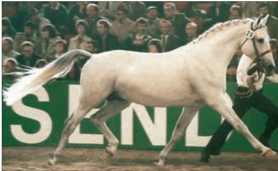
Shagya XXXIX-11, 1973, D-Hassel, von Shagya XXXIX-1 aus der 169 Shagya XXXII-2, war als Shagya I Hauptbeschäler in Bábolna.