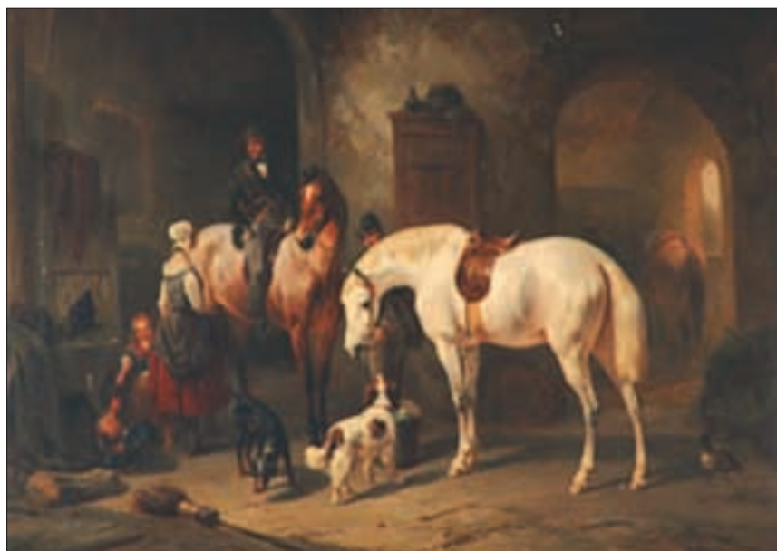
Schloss Slatiny, Aquarell, «Reiseunterbruch vor der Schenke».