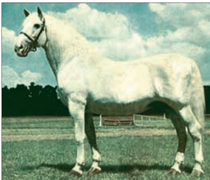
Hengst Generale XXXVII, geboren 1936 (Foto um 1952).