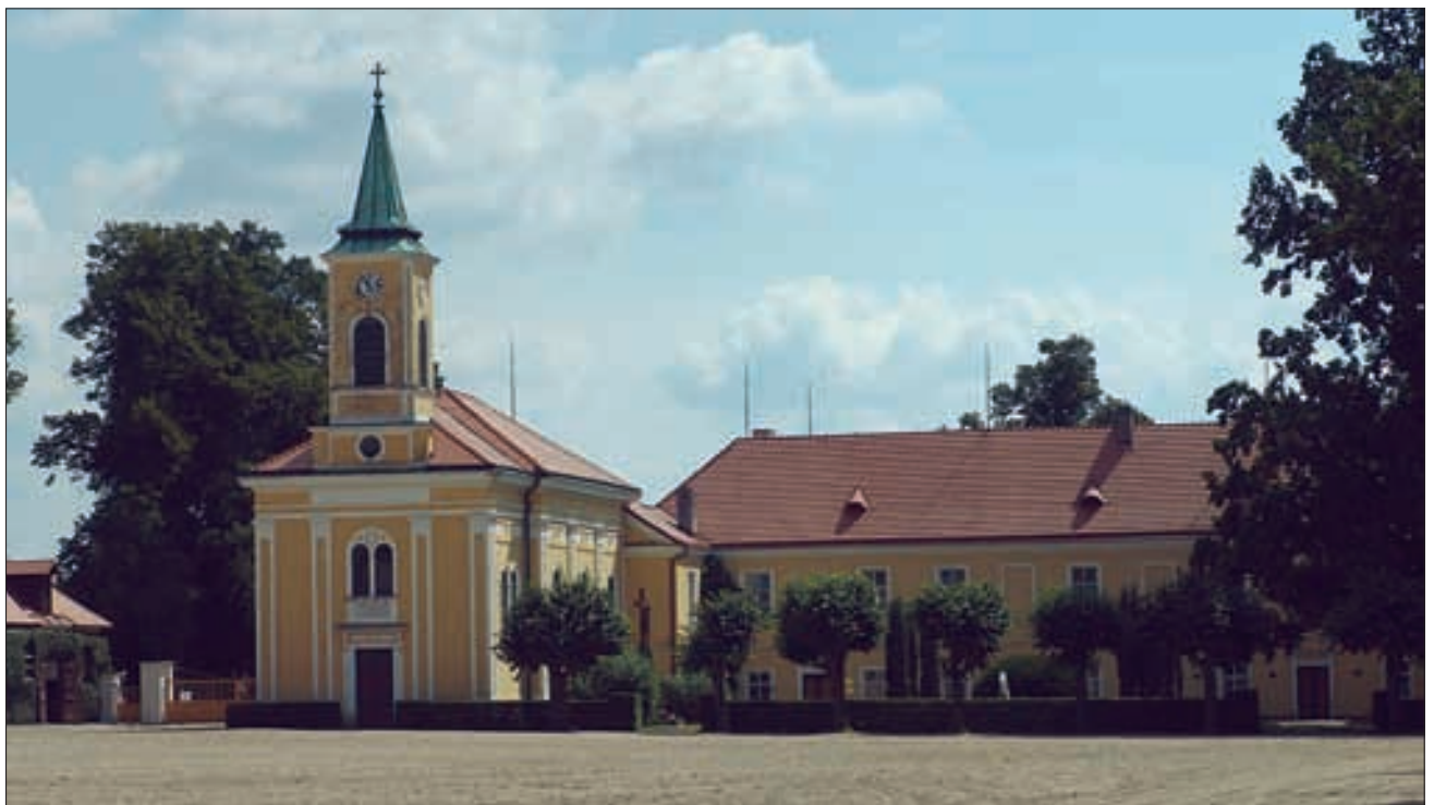
Der Innenhof des Gestütes in Kladrub. Rechts neben der Kirche das Verwaltungsgebäude und links sind noch die Stallungen sichtbar. Das Gestüt präsentiert sich heute in einem gepflegten Zustand