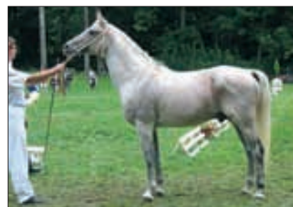
743 Dahoman I-CZ, 1994, Topolcianky von 218 Dahoman X, aus der 476 Hamdan-I. Reservechampion.