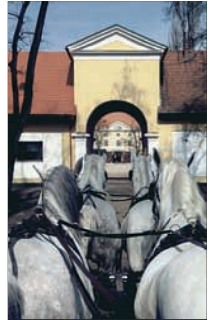
Vierspänner mit Kladruher Hengsten, links in der Ausfahrt des Franzenshofes und rechts vor dem Haupteingang des Gestütes.