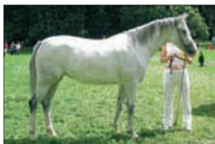
Shakira, 2001, Topolcianky, von 232 Shagya XXV Top., aus der 581 Koheilan IV-52 Top, Championesse der Stuten.