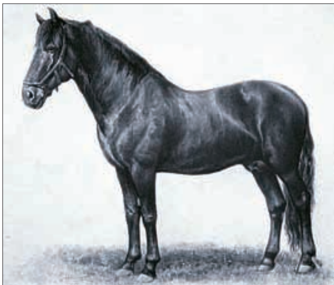
Hengst Sacramoso XXVI, geboren 1889 (Foto um 1905).