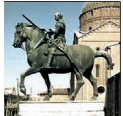
Das berühmte Reiterstandbild vom Söldnerführer Gattamelata (= gefleckte Katze) schuf Donatello (um 1386-1466) im 15. Jh. in fast siebenjähriger Arbeit; es zeigt einen spanisch-italienischen Hengst und steht in Padua.

Vor der drohenden Eroberung des zu Österreich gehörenden Grossherzogtums Lothringen durch den französischen König Ludwig XV. (1710 bis 1774) war das Gestüt des Grossherzogs, Leopold Ludwig Karl von Lothringen, nach Teschen (polnisch: Cieszyn, tschechisch: Český Těšín) verlegt worden, der Hauptstadt des gleichnamigen Fürstentums im Süden des damaligen Herzogtums Schlesien. Dieses Gestüt ging nach dem Tod auf dessen Sohn Franz III. Stephan (1708 bis 1765) über, den späteren römisch-deutschen Kaiser Franz I., und mit ihm an die österreichische Erzherzogin Maria Theresia (1717 bis 1780), die von 1745 an mit ihm den Kaisertitel trug. Die Pferde, die nach Teschen kamen, waren