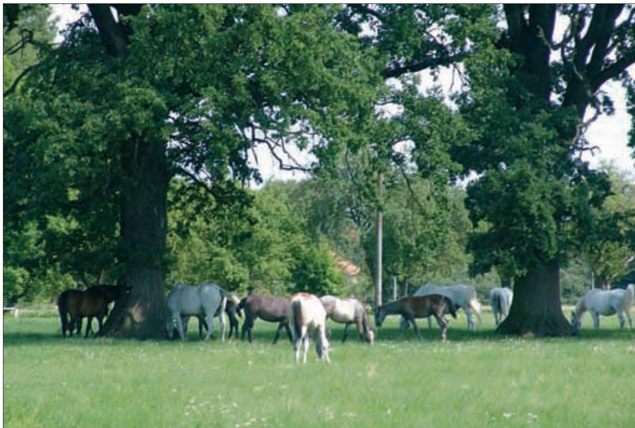
Altkladruher Stutenherde auf riesigen Weiden mit uralten, knorrigen Eichen.