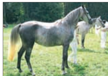
Thora, 2002, CZ-Drahenicky, von 802 Koheilan VI-CZ, aus der Tesla, Jugendchampionesse der Stuten.