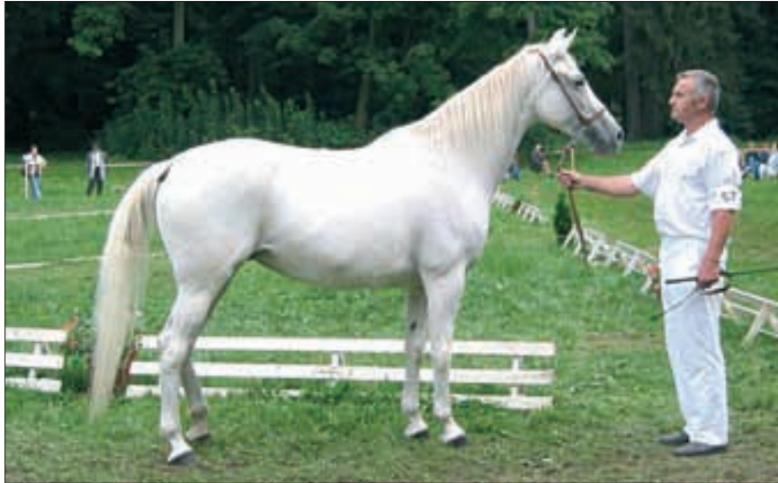
Die wohl schönste Stute der Schau war Tami, 1990, CZ-Albertovec, von 3165 Siglavy Bagdady-26 Top., aus der 659 Tobrok-10 Top. Sie hat aus Nervosität keinen Schritt gezeigt und konnte so nicht reussieren.

Wie immer in der Tschechischen Republik, war die Zusammenarbeit aller Beteiligten sehr kameradschaftlich und effektiv, die Gastfreundschaft überwältigend. Alle freuen sich deshalb, das nächste Mal wieder dabei zu sein und sind den rührigen Veranstaltern für den gelungenen Tag sehr dankbar.