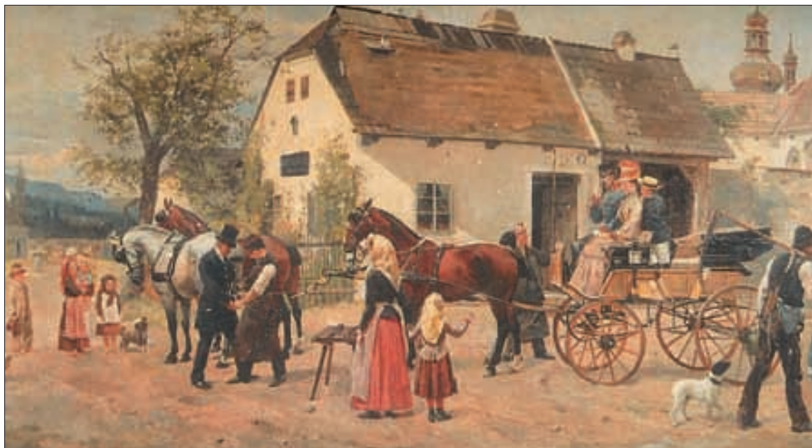
Schloss Slatinany, Aquarell, «Die Schmiede in Slatinany».