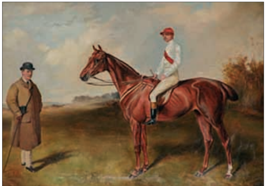
Schloss Slatinany, Aquarell, «Carl Kinsky und Stute Zoedone die Gewinner des Grand National in Liverpool 1883».