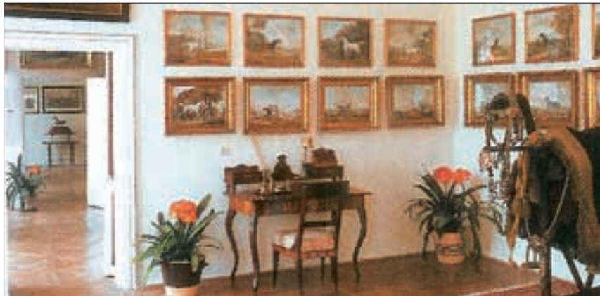
Schloss Slatinany, «Kinderzimmer».