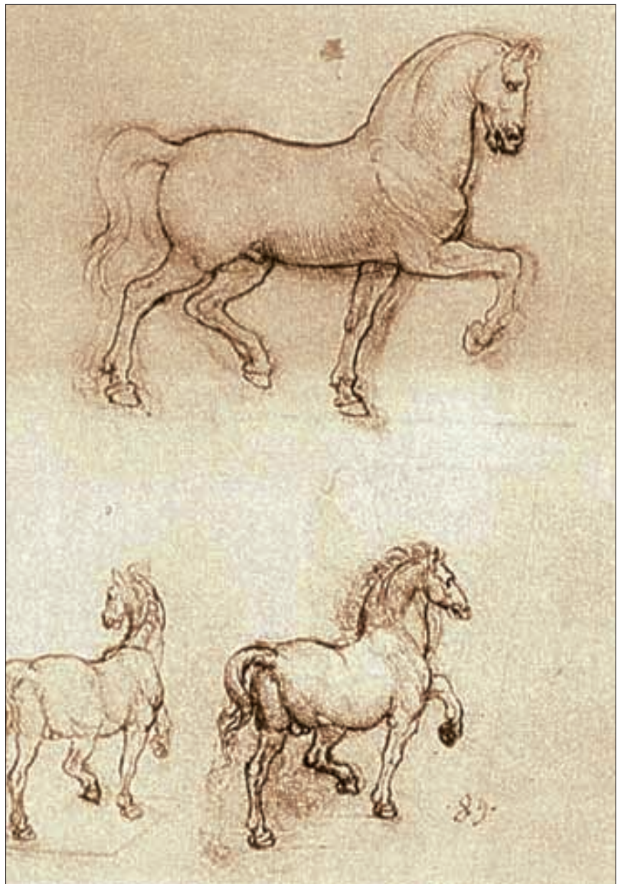
Auch Leonardo da Vinci (1452-1519) hatte in seinem Mailänder Stall als «Vorlagen» spanische-neapolitanische Pferde; seine Pferdestudien aus dem 15. Jh. belegen das eindrucksvoll.

ren 1800, (vorwiegend Rappen) und wenigen Stutenstämmen, deren Gründerinnen die Evakuierungszeit in Enyed überlebt hatten. Zu ihnen kamen im Verlaufe der folgenden zwei Jahrhunderte noch einige bedeutende Zuchttiere, die sich von ihrer Herkunft, vom Typ und von der Farbe her zur Stabilisierung des Altkladrubers eigneten. Unter anderen wurde der Rapphengst Napoleone, geboren 1845, aus Italien eingeführt, um die ausgestorbene Rappen-Linie des Sacramoso (Gestüt Ried bei Hallein, Erzbistum Salzburg), geboren 1799, fortzusetzen, die später mit Romke, gebo-