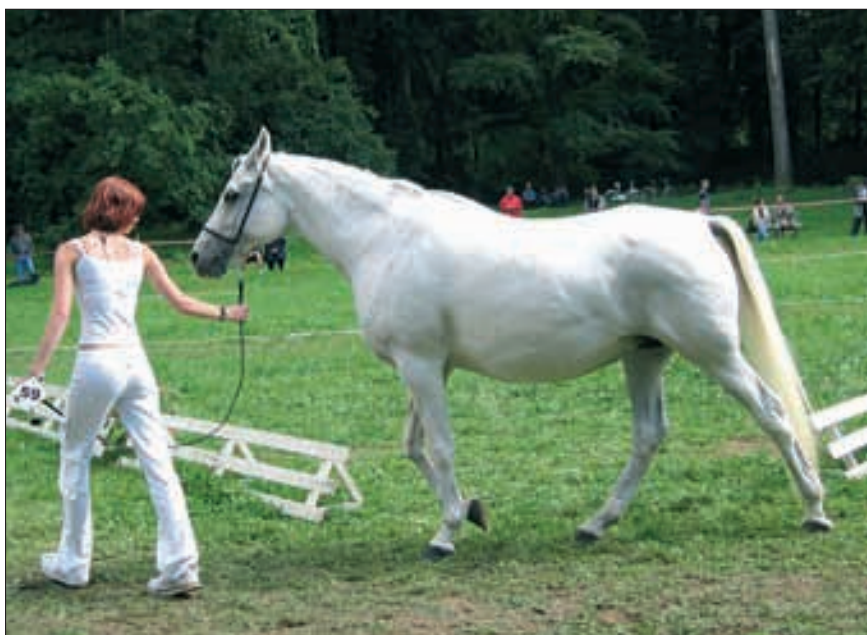
Hasana, 1988, CZ-Pisek, von 883 Sultan, 1978, Topolcianky aus der Kuhailan Urkub-20, 1972, Topolcianky, wurde speziell für ihre Zuchtleistungen geehrt. Acht Kinder und neun Enkel zeigt die beachtliche Nachkommenliste auf.