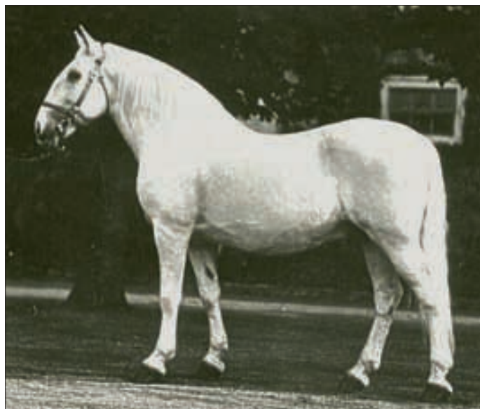
Hengst Generale XXXIII, geboren 1920 (Foto 1934).