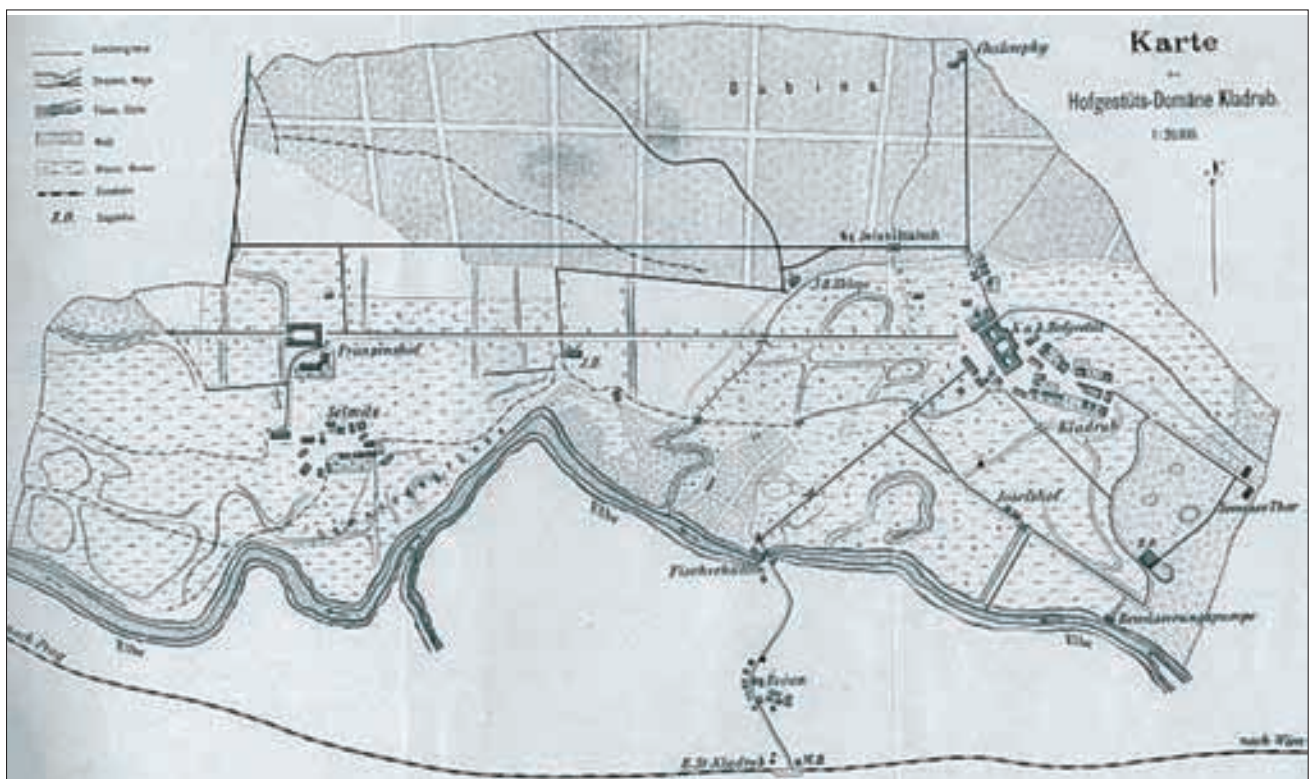
Karte des Gestütes Kladrub um 1890.

Starokladrubský Kun) ist durch dramatische Ereignisse gekennzeichnet. Sie beginnt damit, dass die böhmischen Stände und der Adel anlässlich der Krönung des österreichischen Erzherzogs Maximilian (1527 bis 1576) zum König von Böhmen 1562 (römisch-deutscher Kaiser wurde er 1564 als Maximilian II.) ein geeignetes Geschenk suchten. Sie fanden es schliesslich in der umfangreichen, aber hoch verschuldeten Herrschaft Pardubice des Johann von Pernstein, zu der auch das Dorf Kladrub mit der Meierei Keci und dem Tiergarten gehörte. Dessen Vater, Wilhelm von Pernstein und Helfenstein, hatte diesen ursprünglichen Klosterbesitz 1491 erworben, danach das Flussbett der Elbe regulieren, den Opatovicer Kanal zur Grünland-Bewässerung sowie den Kladruher Tiergarten anlegen lassen. Dieses riesige Besitztum mit weiteren sieben Stadt- und 127 Dorfgemeinden wurde für Maximilian gekauft und der Betrag ging in der königlichen Kammer zu Prag 1560 und 1561 ein.