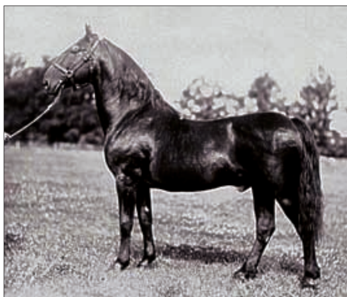
Hengst Sacramoso XXX, geboren 1927 (Foto 22jährig, 1949).