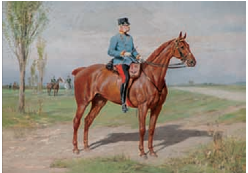
Schloss Slatinany, Aquarell, «Kaiser Franz Josef».

Die feierliche Eröffnung des staatlichen hippologischen Museums in Slatinany fand am 1. Oktober 1950 statt. Der Teil «Das Pferd in der Kunst» wurde zu diesem Datum der Öffentlichkeit zugänglich gemacht. Unzählige faszinierende Pferdebilder sind in den alt ehrwürdigen Räumen ausgestellt. Tagelang könnte man sich von der Aesthetik der Exponate verzaubern lassen. Die Entwicklung des Museums wurde durch die Eröffnung nicht beendet. Die Sammlung wurde schrittweise ergänzt und bereichert. Die Ausstellung wird laufend modernisiert und es werden neue Präsentationsformen gesucht. Der Besuch im Museum des Schlosses in Slatinany ist ein einmaliges Erlebnis und ein Besuch des Gestüts ohne Museumsbesuch ist undenkbar. (bf)