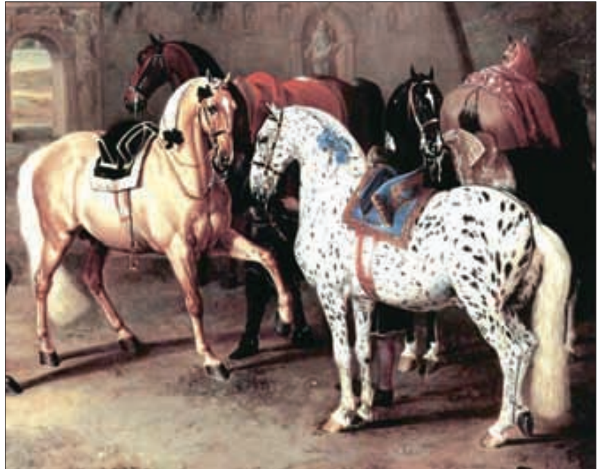
John George Hamilton (1720-1787) schuf um 1750 das Gemälde von der kaiserlichen Reitschule in Wien. In diesem Ausschnitt sind spanisch-italienische Pferde zu sehen, wie sie damals an fast allen Fürstenhöfen Europas verwendet wurden.

vorwiegend in den Hofgestüten Halbthurn (etwa 80 km südöstlich Wien, damals ungarisch, gegründet um 1745 bis um 1888) und Lipizza für den Wiener und Prager Hof gezüchtet wurden. Bis zum Ausbruch des Siebenjährigen Krieges (1756 bis 1763) blieb diese Entwicklung einigermaßen konstant.