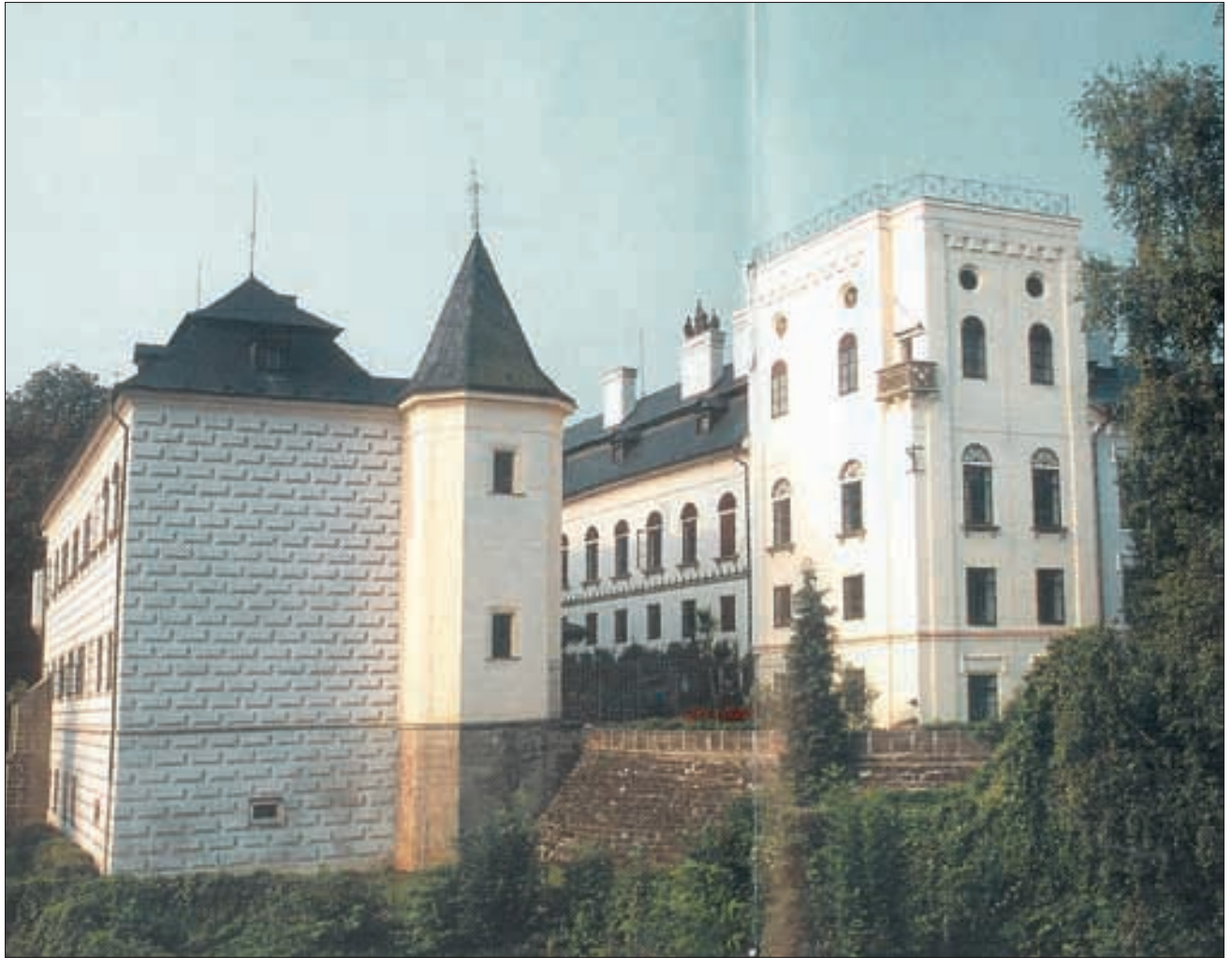
Schloss Slatinany, der Blick von Norden. Dieses Gebäude beherbergt eine Sammlung unzähliger Pferdebilder.