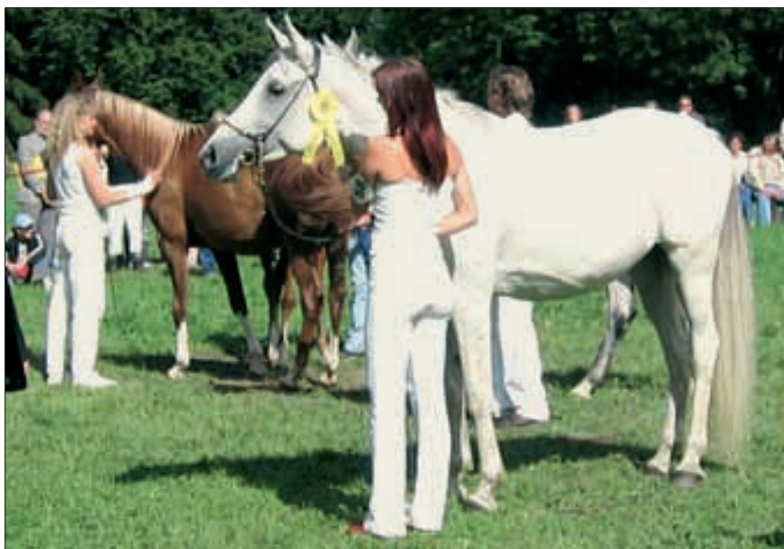
Hasima, 1992, CZ-Talin, von 853 Shagya-I CZ, 1982, Topolcianky aus der Hasana, 1988, Pisek. Sie war Siegerin der Klasse der alten Stuten.