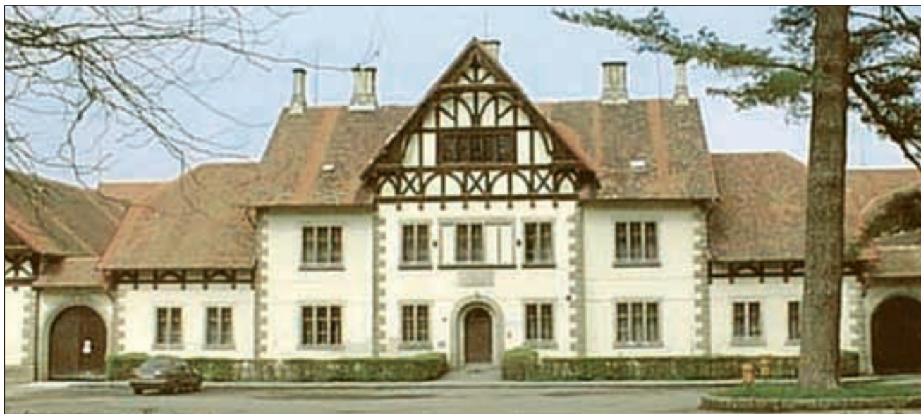
Gestütshof von Slatinany, Vorderfront.