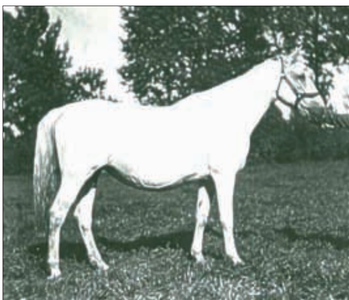
Stute 406 Generale XXXIV, geboren 1929 (Foto 1946).