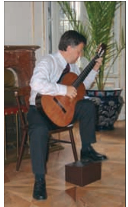
Schloss Slatinany, als besondere Überraschung wird dem Besucher als Abwechslung, ein Musikvortrag angeboten. In diesem Falle war es ein erstklassiger Konzert-Gitarrist, der den Besuch im Schloss nebst den einmaligen Bildern zu einem kulturellen Hochgenuss abrundete.