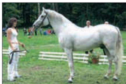
781 Shagya V-CZ, 1995, CZ-Holice von Shagya XXIII Top., aus der 449 Ubayan-5. Champion der Hengste.

Halle drei Przewalski-Pferde für die Landwirtschaftliche Hochschule in Prag erworben. Sie bildeten ab 1932 den Grundstock der Zucht im Zoologischen Garten Prag und damit später auch der kleinen Zuchtgruppe in Slatinany. Seit 1939 suchte er die Reste der Altkladruber Rappen im Lande zusammen und begann von 1941 an mit der Aufstockung