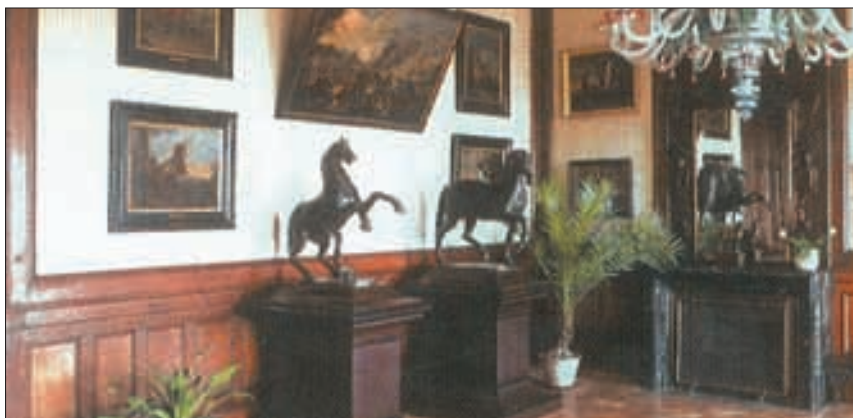
Schloss Slatinany, «Der schwarze Salon».