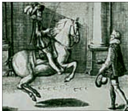
Reitmeister Antoine de Pluvinel (1555-1620) unterrichtet den französischen König Ludwig XIII (1601-1643) auf einem spanisch-neapolitanischem Hengst (Courbette), um 1619.

Dass die Tschechische Republik zu ihrer Erhaltung beispielhafte Unterstützung gewährt, sichert auch ihre Zukunft.