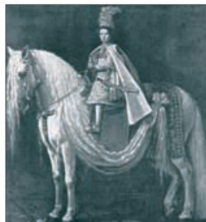
Ein spanisch-neapolitanischer Hengst 1615 mit dem 11-jährigen Alexander Fürst Moghila der Moldau im Sattel. Beachtenswert ist die mehrere Meter lange, gepflegte Mähne des Pferdes.

1490), das sachsen-anhaltinische Allenstedt (gegründet vor 1134) und Merseburg (gegründet 1563), das bayerische Rohrenfeld (gegründet 1571), das dänische Frederiksborg (gegründet 1532) oder das heute ukrainische Slawuta (gegründet 1506).